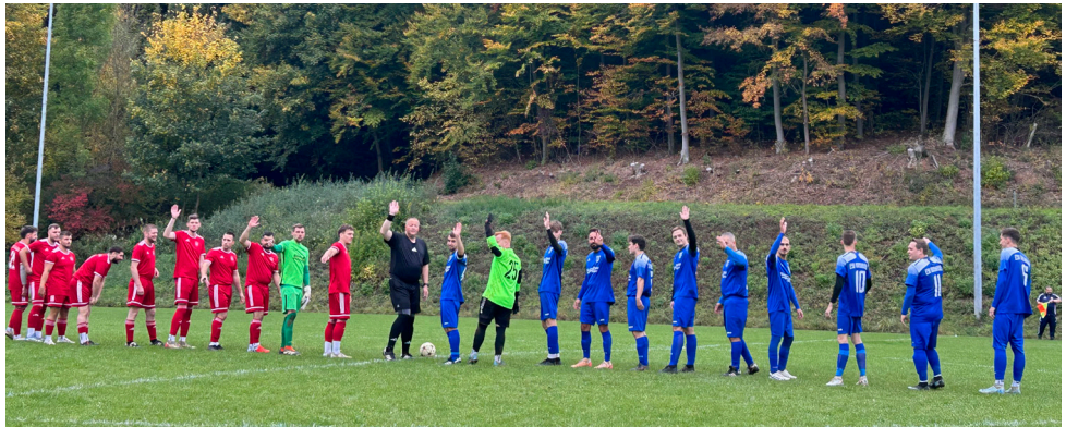
Nicht anders erging es der Ersten, die hier noch frohen Mutes zuwinkte. In einem engagierten und couragierten Spiel war unser Team über die gesamte Spielzeit die spielbestimmende Mannschaft. Beste Chancen wurden nicht genutzt und so führten nur wenige individuelle Fehler zu einem gar nicht dem Spiel entsprechenden Ergebnis. Absolut schade und nicht gerecht.